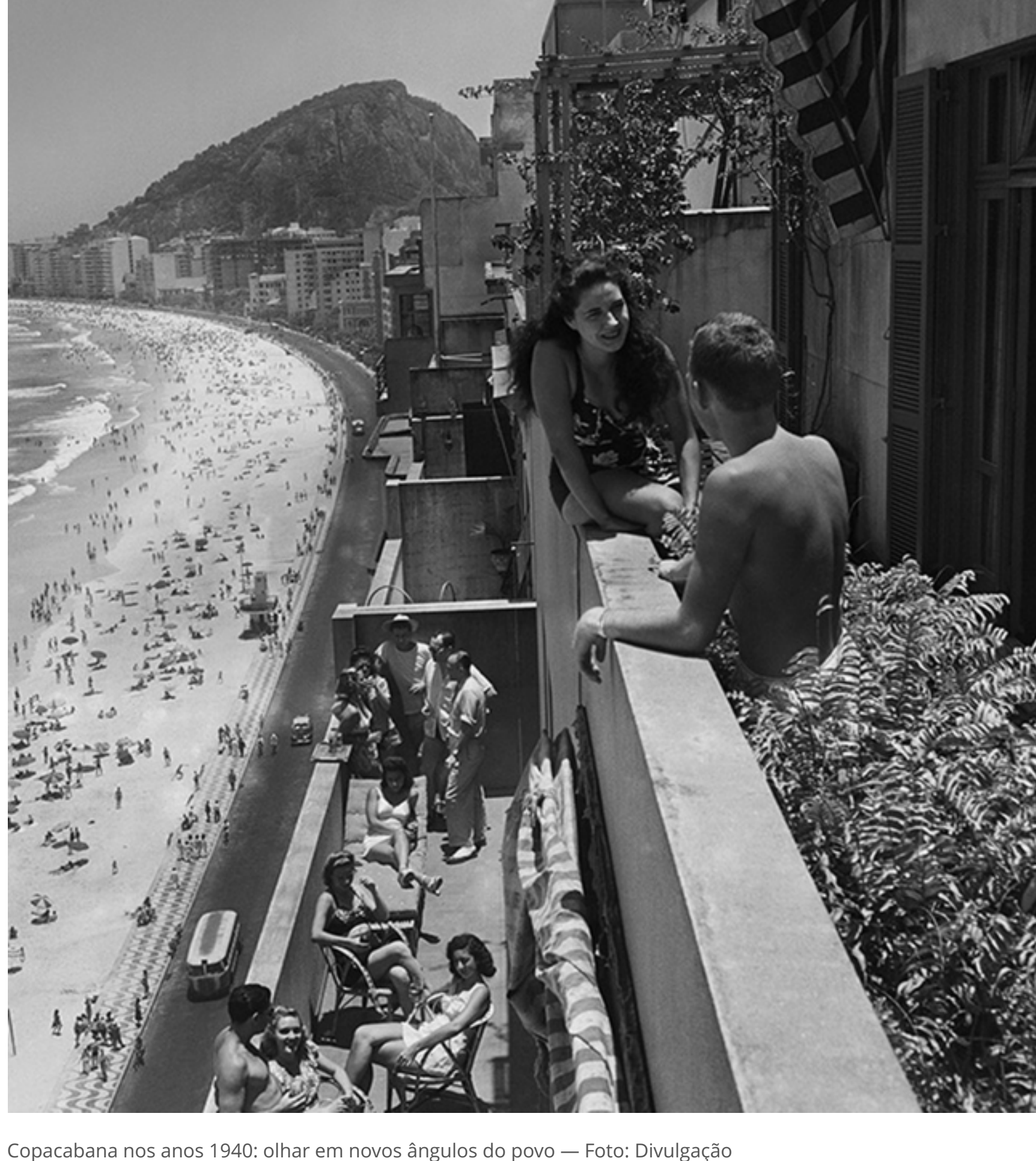
Copacabana nos anos 1940: olhar em novos ângulos do povo

Klagsbrunn desembarcou no Brasil em março de 1939 com a câmera que seria seu passaporte para uma nova vida, como destacam seus familiares. Uma das primeiras fotos que fez foi a da Ilha das Flores (RJ), que tinha se convertido num local de registro, controle médico e sanitário e encaminhamento de imigrantes.