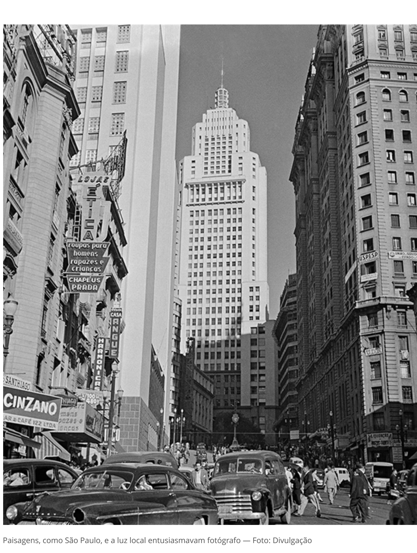
Paisagens, como São Paulo, e a luz local entusiasmavam fotógrafo

Uma parte dessas fotos, de inegável valor documental e artístico, está em exposição neste mês em Genebra, na Maison Juive Dumas. Trata-se da mostra "O Brasil aos Olhos de Kurt Klagsbrunn". Ela foi concebida para ocorrer juntamente com a exposição "Legado do Exílio (1933-1945) - Contribuição dos Refugiados da Segunda Guerra Mundial para o Brasil".