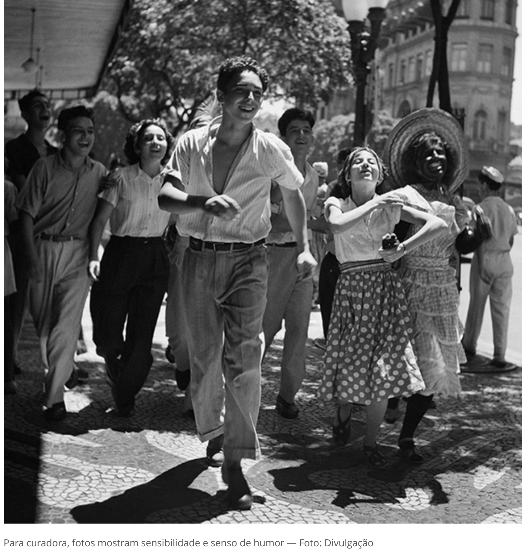
Para curadora, fotos mostram sensibilidade e senso de humor

Uma parte dessas fotos, de inegável valor documental e artístico, está em exposição neste mês em Genebra, na Maison Juive Dumas. Trata-se da mostra "O Brasil aos Olhos de Kurt Klagsbrunn". Ela foi concebida para ocorrer juntamente com a exposição "Legado do Exílio (1933-1945) - Contribuição dos Refugiados da Segunda Guerra Mundial para o Brasil".